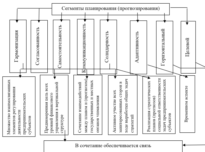
Рис. 2. Сегменты принципов планирования (прогнозирования), которые должны соблюдаться у предпринимательских субъектов

Не менее важным является и горизонтальный уровень планирования (прогнозирования), который предполагает согласование планов (прогнозов) с документами территориальных уровней управления — местного и государственного, а также их гармоничное сочетание с направлениями развития внешней среды (Рис. 2).