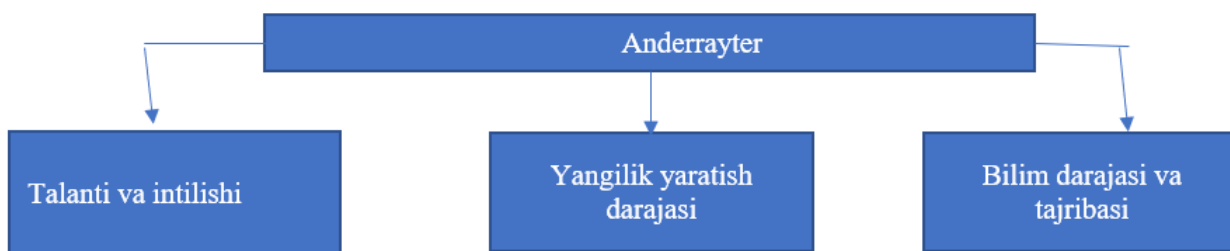
3-rasm. Sug'urta anderrayterlari uchun sifat ko'rsatkichlari 3

O'zbekiston sug'urta bozorining peshqadam professional ishtirokchilaridan biri — "O'zbekinvest" kompaniyasida anderrayterlarning bilimi va savodxonligini oshirish, shuningdek, kompaniya va sug'urta bozorida yangiliklar bilan ularni tanishtirib borish maqsadida 2020-yildan boshlab "Sug'urta maktabi" tashkil etilgan. Mazkur maktab orqali sohaga zarur bo'lgan anderrayterlar tayyorlanmoqda va ularning malaka oshirish tizimi yo'lga qo'yilgan (3-rasm).