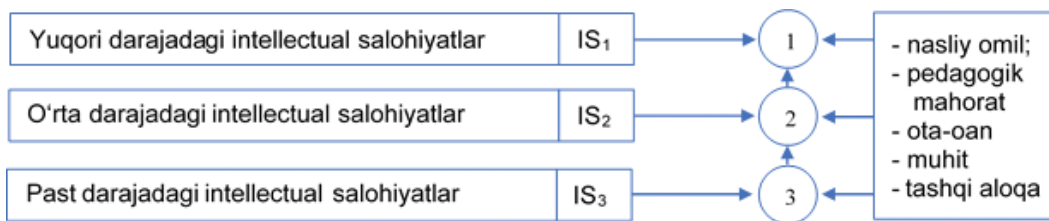
2 - r a s m: Millatning intellektual salohiyatini takomillashtirish mexanizmi

Tabiiyki, ikkinchi guruh birinchiga, uchinchi guruh ikkinchiga intiladi. Ushbu jarayonda asosan bilim beruvchi pedagog va uning mahorati, oila va atrof-muhit muhim hisoblanadi. Guruhda ta'lim olayotgan bolalar, talabalar yuqorida qayt etilgan uch guruhni tashkil qiladi, ya'ni, ular yuqori (IS 1 ), o'rta (IS 2 ) va past (IS 3 ) darajadagi intellektual salohiyatga egadirlar. Ularning salmog'i fanlar va mutaxassislik bo'yicha har xil miqdorga ega. Ushbu holatni to'g'ri baholab, o'quv jarayonini samarali tashkil qilish pedagogning mahoratiga bog'liq bo'ladi. Shuni ta'kidlash joizki, bugungi kunda intellektual salohiyatni baholash bo'yicha usullar va ba'zi ko'rsatkichlar mavjud, ammo, ular to'liq talablarga javob bermaydi, takomillashtirish lozim. Ya'ni qaysi omillar qay darajada intellektual salohiyatni oshirishini baholash muhim hisoblanadi.