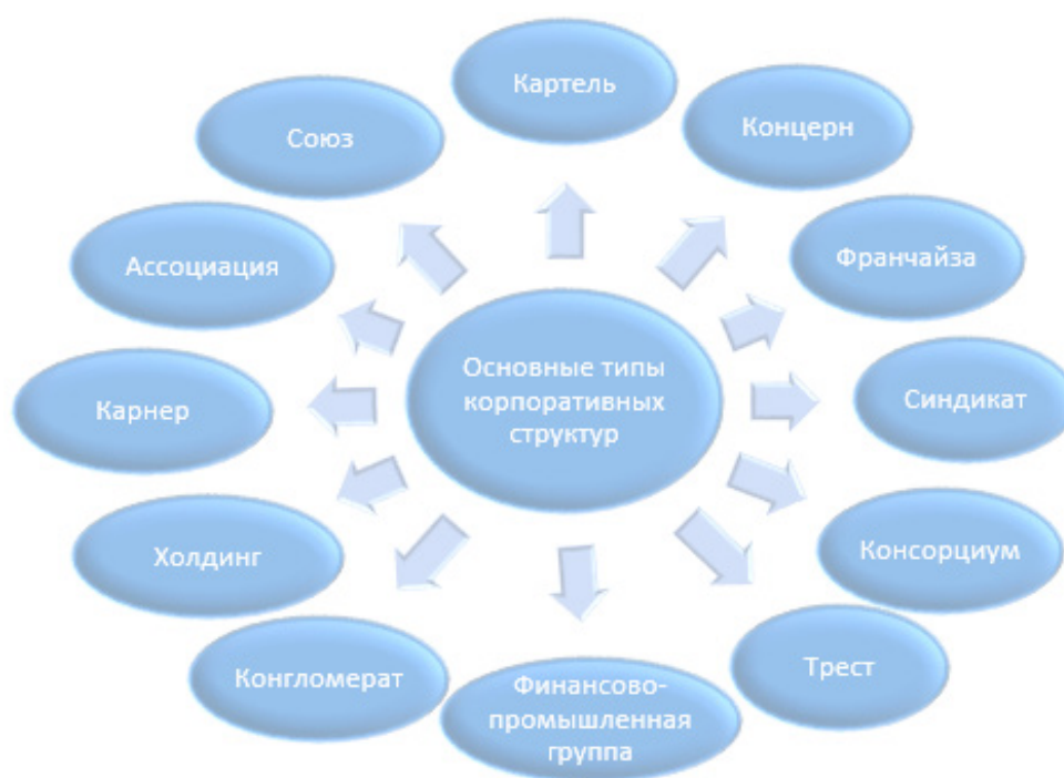
Рисунок 1: Основные типы корпоративных структур

Мы можем представить на рисунке 1, основные типы корпоративных структур.