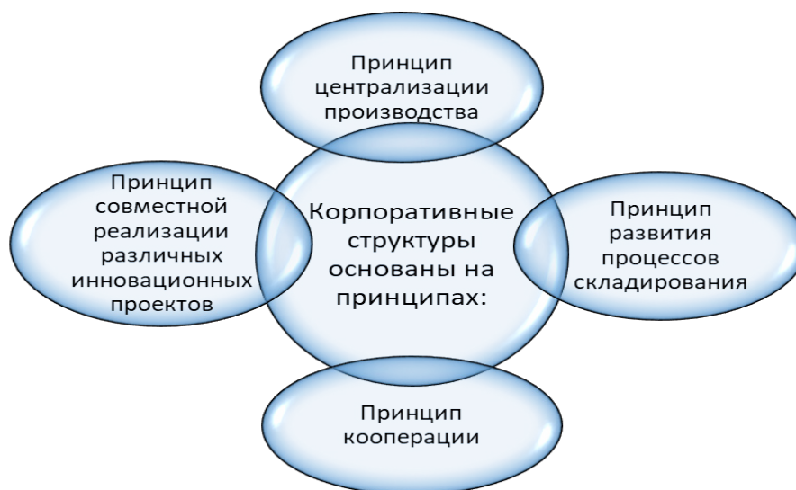
Рисунок 2: Принципы корпоративных структур

Целью корпоративных структур является получение высокой и устойчивой прибыли с помощью более рационального использования имеющихся ресурсов, разработка и выпуск новых видов продукции и услуг, что, в конечном счете, обеспечивает и ускорение социально-экономического развития в отдельных странах. Принципы корпоративных структур рассмотрены на рисунке 2.