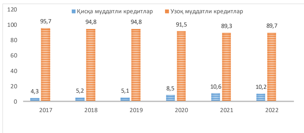
1-rasm: O‘zbekiston Respublikasi tijorat banklari kreditlarining muddatlari bo‘yicha taqsimlanishi [11], foizda

Shunisi xarakterliki, O‘zbekiston Respublikasi tijorat banklari kreditlarining asosiy qismini uzoq muddatli kreditlar tashkil etadi (1-rasm).